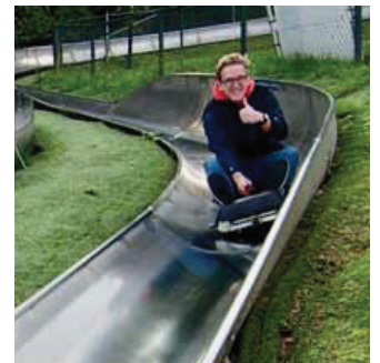
Links: op camping Den Driesch in Valkenburg; boven: op de rodelbaan in Valkenburg