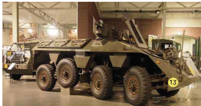
Boven: Tim is deze week de chef; Kees verzinkt in mijmeringen bij het zien van de YP in het DAF-museum; rechts: mannen – bier en voetbal ...; onder: mountainbiken door de Zuid-Limburgse mergelgrotten