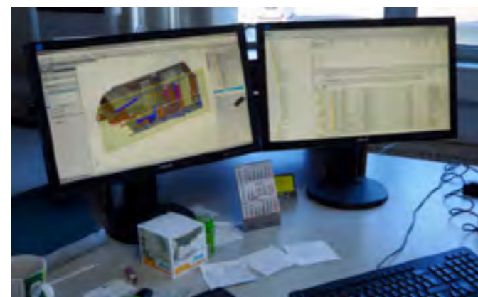
De bouw begint achter de computer; door alle opties nauwkeurig te verwerken, loopt het logistiek in de fabriek straks op rolletjes

Redacteuren van TopCamper magazine liepen mee tijdens de bouw van een integraalcamper bij Eura Mobil in het Duitse Sprendlingen. Ook deze fabriek lijkt een assemblagefabriek, maar assemblage is een understatement als we het hebben over camperbouw: de verschillende onderdelen worden hier samengebracht om tot één camper te worden geconstrueerd. Meubelfabricage gebeurt in de eigen meubelafdeling, de polyester wanden en het dito dak arriveren vanuit een zusterbedrijf binnen de Triganogroep. De opbouw is geheel houtvrij en alle modellen bezitten een dubbele bodem. We volgen stapsgewijs de productielijn.