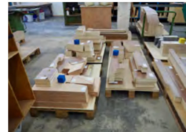
Gezaagde delen klaar voor transport naar de meubelmakerij