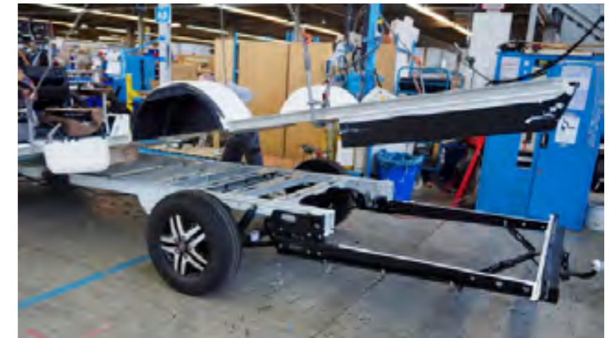
De polyester bodemplaat wordt op het chassis gelijmd