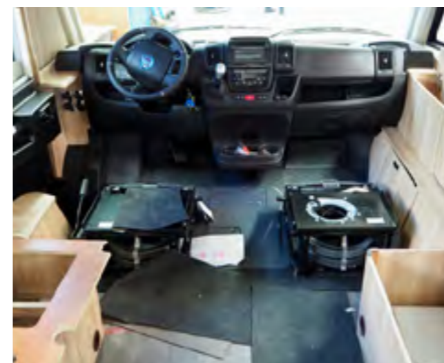
Luxe alom, Alde verwarming onder de stoelen