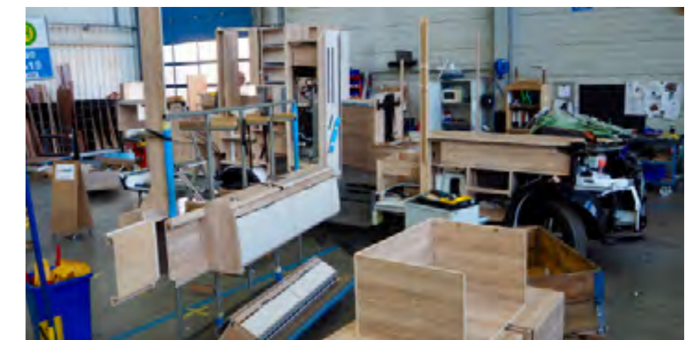
Alle meubels verzameld naast de camper, klaar voor inbouw