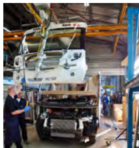
Spectaculair gezicht: het front hangt klaar voor montage