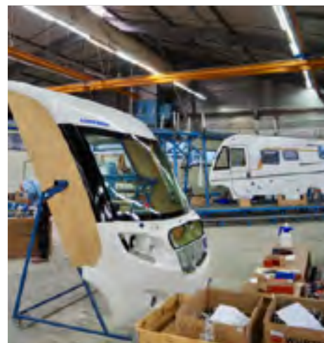
Front en wanden wachten op montage