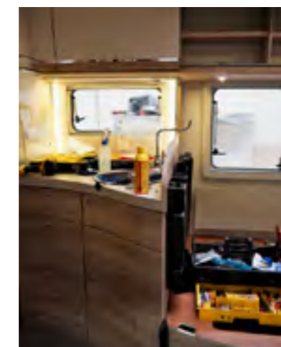
Veel gereedschap is nodig voor een nette afwerking van de binnenzijde