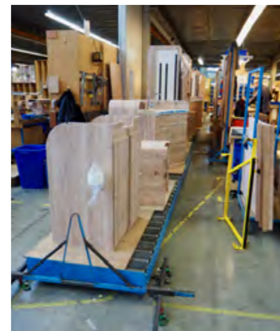
Meubels gereed voor montage