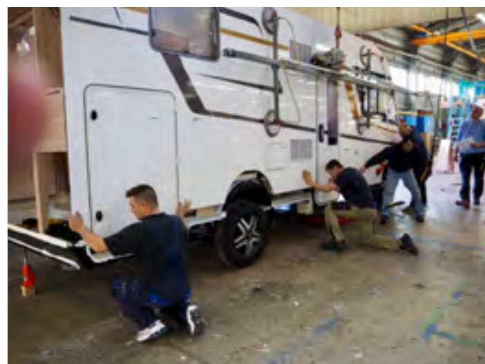
Met grote precisie laat men de zijwand in het profiel zakken waarna wand en bodem worden verlijmd

'Ook wij profiteren van de economische groei en we verwachten dat de Triganogroep in 2017 Europees marktleider is. Bij Eura Mobil zal de productie voor dit seizoen (tot de zomer) uitkomen op 1600 stuks, 200 meer dan vorig seizoen. Ook de merken Forster en Karmann zijn onderdeel van Eura Mobil; de productie daarvan vindt plaats in Frankrijk en Italië. Echter, de eindcontrole gebeurt hier in de fabriek in Sprendlingen want: vertrouwen is goed maar controleren is beter!'