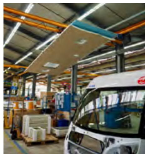
Het laatste huzarenstukje: het dak op reis naar de camper