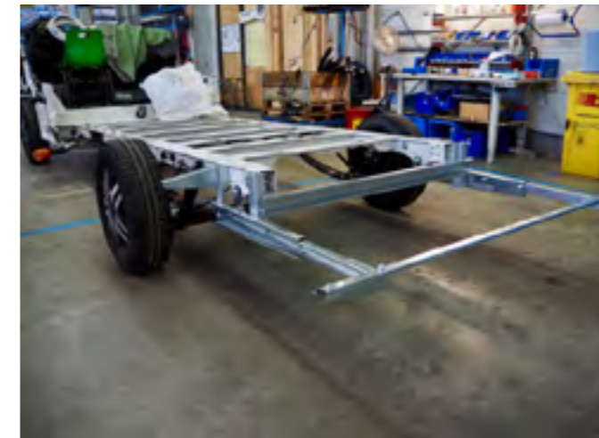
Allereerst wordt het Fiat-chassis verlengd