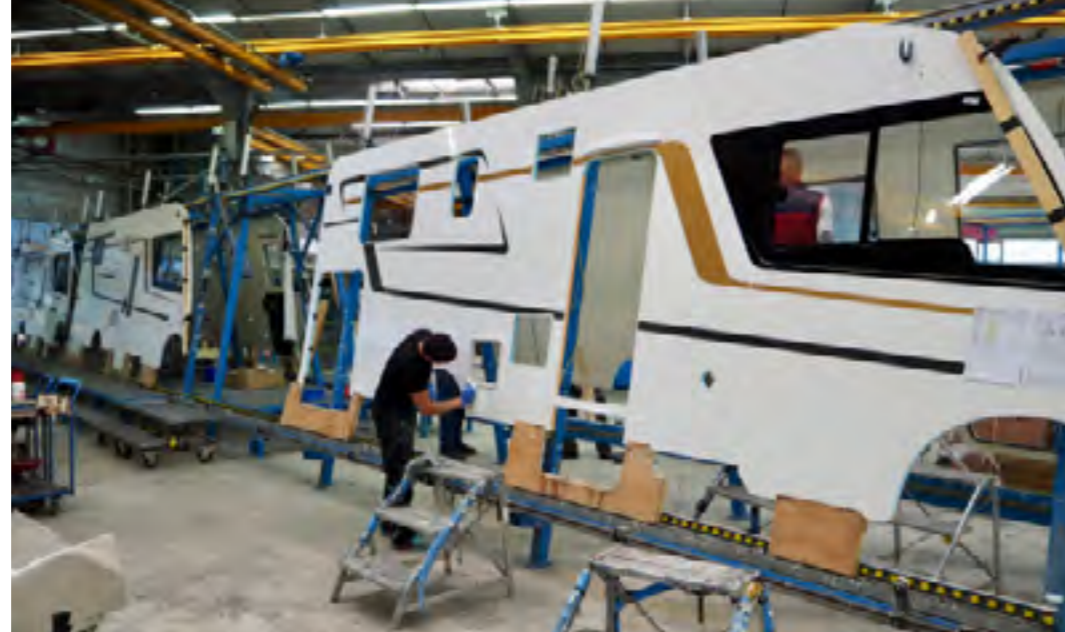
De zijwanden worden voorzien van alle benodigde ramen, deuren en kleppen