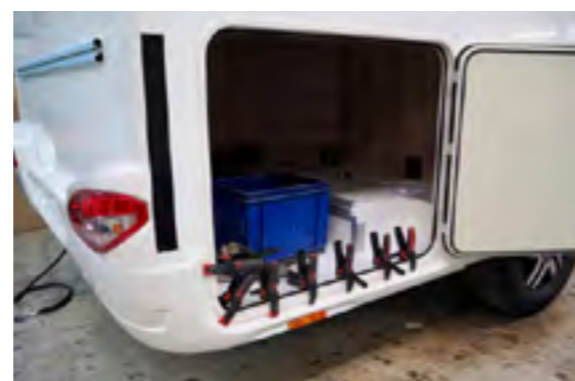
Aan lijkklems geen gebrek bij Eura Mobil