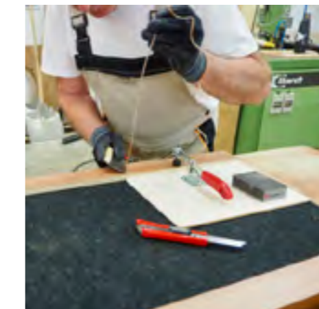
Handmatige bewerking van meubeldelen