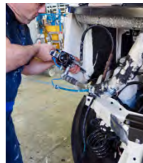
Aan de voorzijde wordt de zijwand verlijmd met het chassis