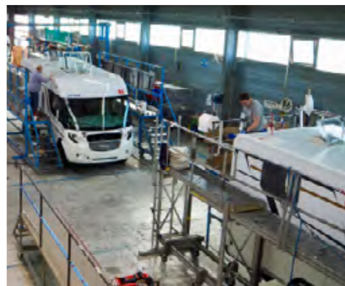
Na het aanbrengen van het dak worden naden en dergelijke afgewerkt, een secuur klusje