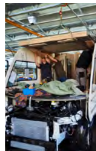
Pittige klus: montage van het hefbed boven de cabine