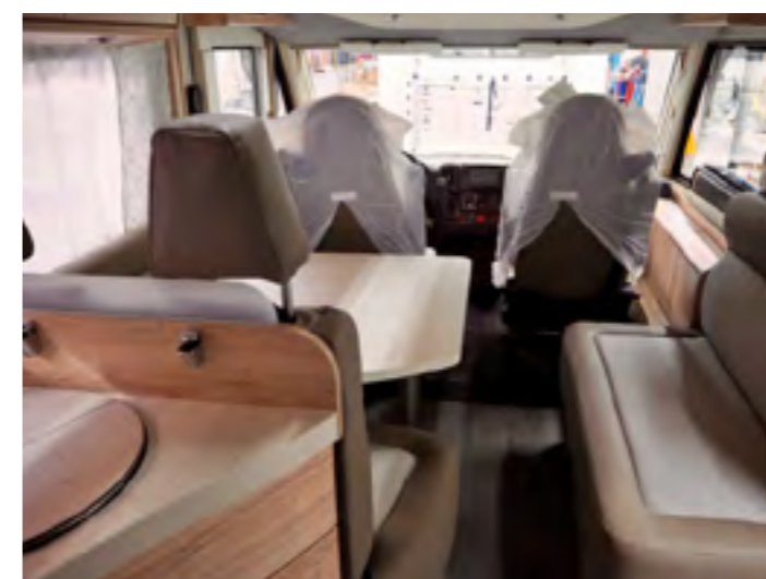
Na een uitvoerige kwaliteitscontrole komt de finishing touch: kussens en gordijnen