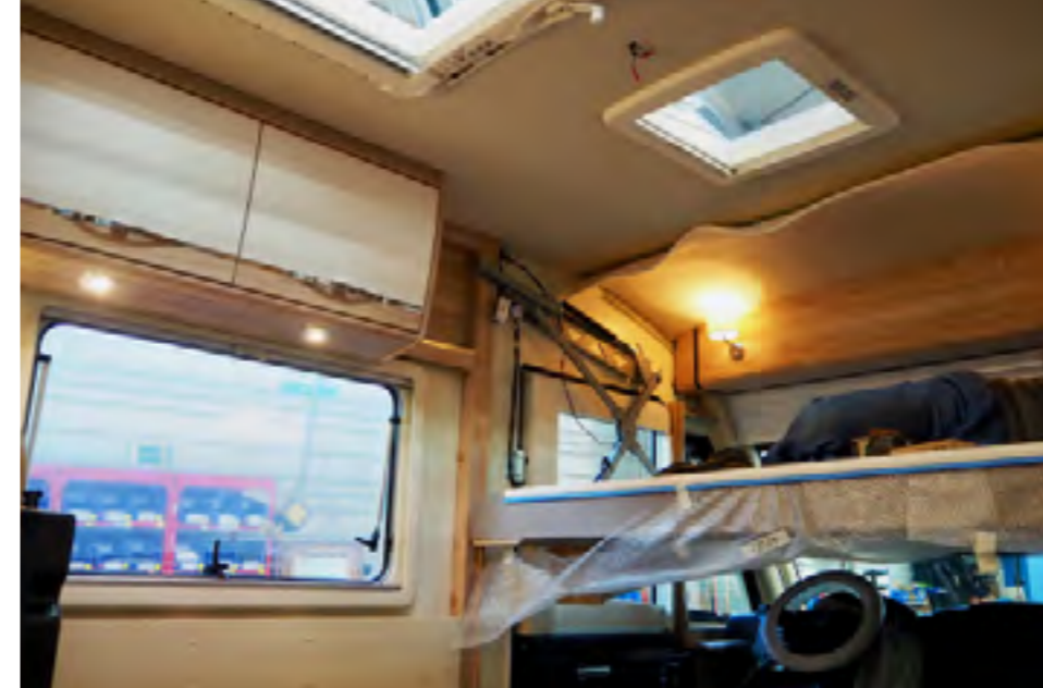
Behendigheid is vereist om de dakbekleding af te werken