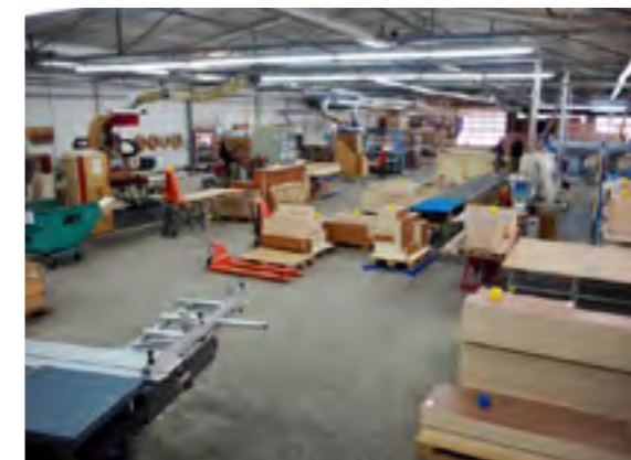
De meubelzagerij zit in dezelfde fabriek