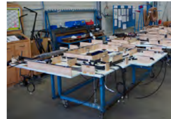
De vloer ligt omgekeerd klaar voor het vastmaken van allerlei kabels en leidingen