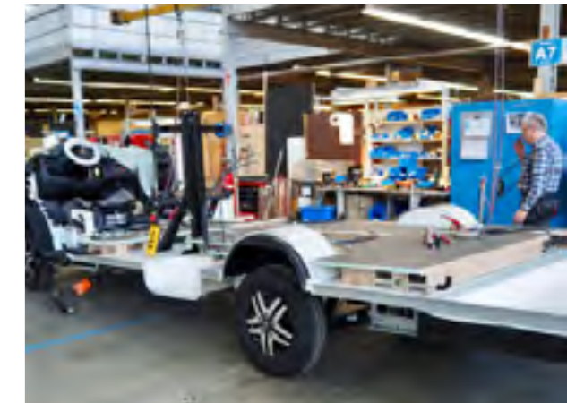
Montage van de vloer op de bodemplaat met als resultaat een dubbele bodem