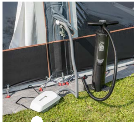
Twee pompen, de kleine elektrische is optioneel maar is top!